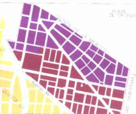
PLANO DE URBANIZACIONES

La arquitectura de cada una de las etapas caracteriza al barrio en sus subsectores. Esto matizado con la traza de calles curvas y no continuas le otorga a este barrio un carácter singular dentro del contexto urbano ampliado. Su dinámica económica amenaza desaparecer estas cualidades.