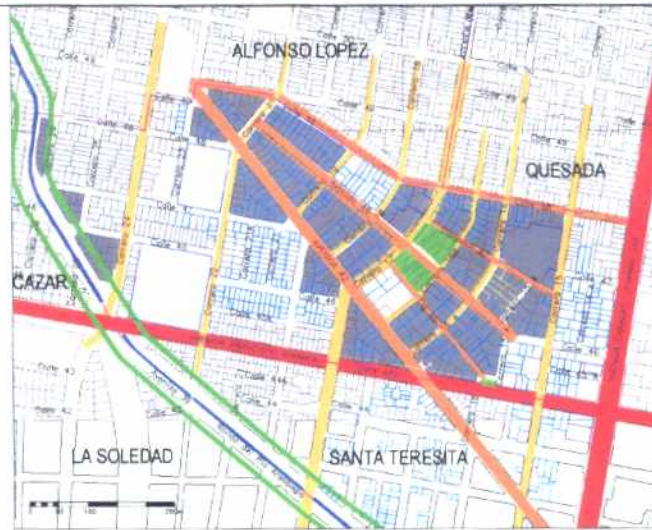
Inmuebles de Interés Cultural - MORFOLOGÍA EN PLANTA