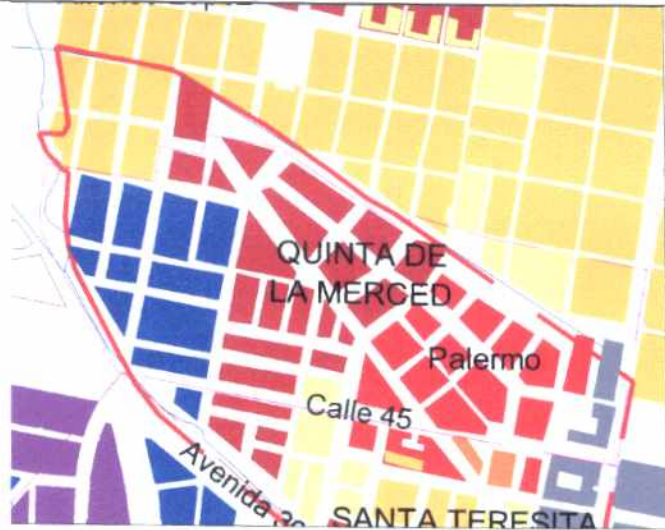
CRECIMIENTO HISTÓRICO - CRONOLOGÍA